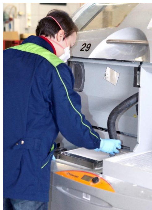
Kuva. Ylimääräisen jauheen poisto imuroimalla.

www.tyosuojelu.fi/tyoolot/kemialliset-tekijat/raja-arvot