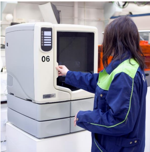
Kuva. Koteloitu tulostin.

Näitä arvoja voidaan soveltaa, mikäli kyseiselle pölylle ei ole erillistä HTP-arvoa.