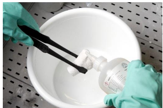
Kuva. Tulostetun kappaleen puhdistus koskematta kemikaaliin tai kappaleeseen.

Pintakäsittely: Kappaleiden pintakäsittelyssä käytetään erilaisia kemikaaleja. Liuottimet voivat aiheuttaa keskushermosto-oireita. Erityisesti on suojauduttava käytettäessä allergisoivia epokseja sekä syanoakrylaatti- ja akrylaattiyhdisteitä. Isosyanaattipitoiset maalit voivat ärsyttää ihoa ja hengitysteitä, ja aiheuttaa astmaa tai allergiaa.